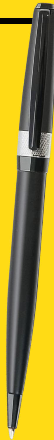
SAVONA BLACK, GREY MINIMAL