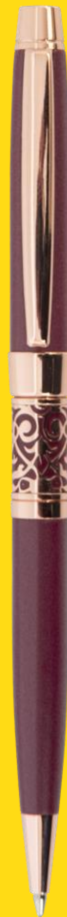
VENEZIA RED MATTE