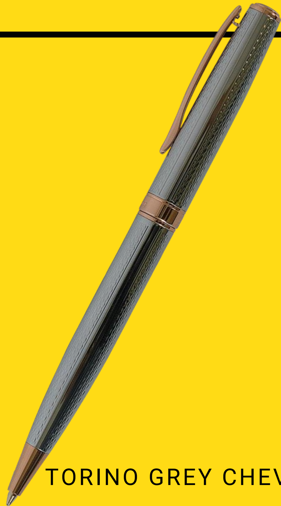
TORINO GREY CHEVRON