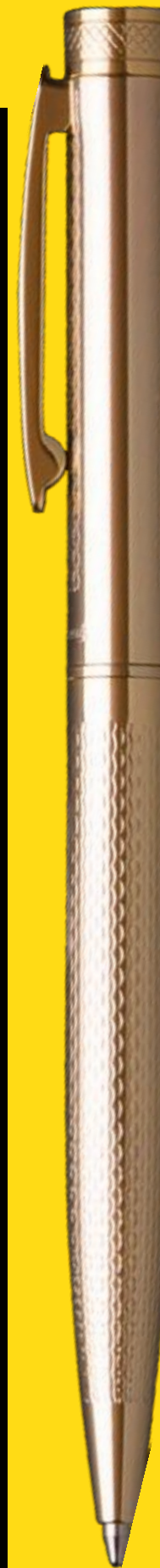
TREVISO GOLD CHEVRON