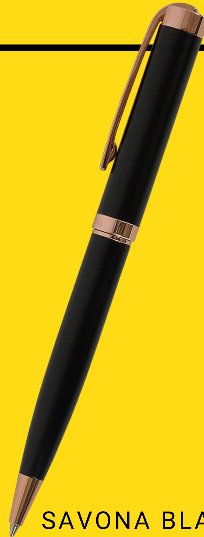
SAVONA BLACK MATTE