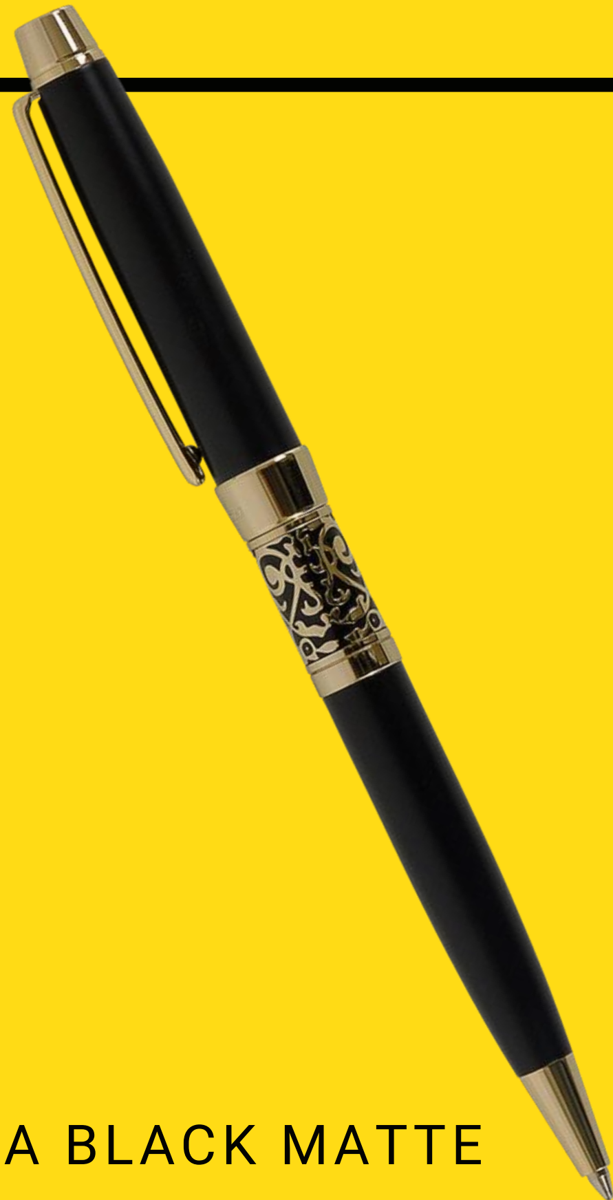
VENEZIA BLACK MATTE