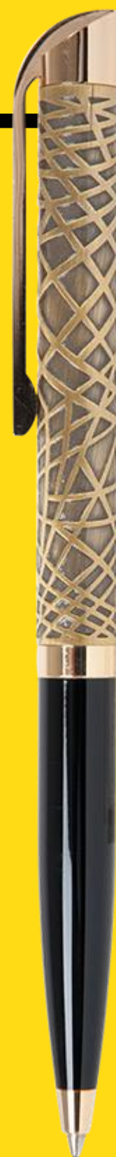
PESARO GOLD LUXURY