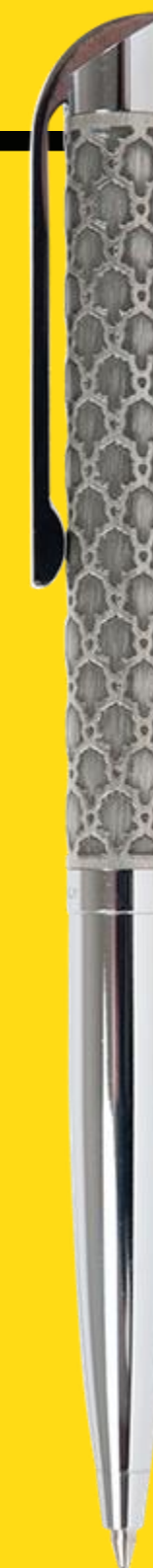
PESARO SILVER LUXURY